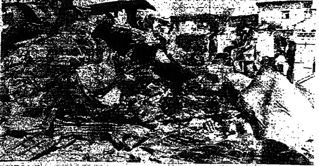
اكواخ نهجت انشاء الضخبات في منطقة النهر